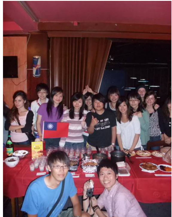
Buddy System—International Dinner