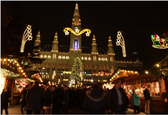
維也納的聖誕市集