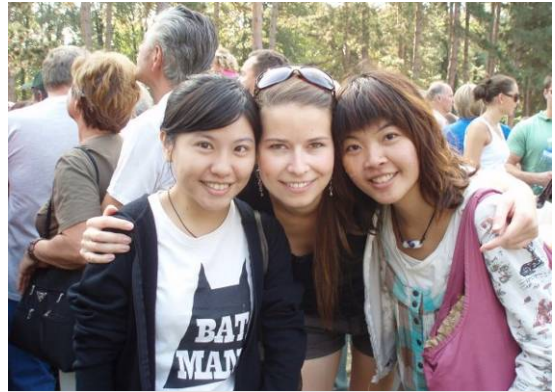
我跟中山人管所的學姐及我們的Buddy

這半年我認識許許多多來自世界各地的朋友，踏遍了十個國家，二十八個城市，雖然旅行中偶爾感到孤獨，但在途中遇到新的事物及朋友，接觸不一樣的東西，可以讓心情常保新鮮，這讓我非常開心，我會帶著滿滿的回憶且嶄新的自己回去台灣，重新在這塊母土上呼吸。我想這些自身經歷是別人取代不了我的。有時得在一個全然陌生的環境，才能完全激發自己面對危機的本能，才能找到自己最脆弱也是最堅強的地方，因為獨自處在陌生的環境，只有自己一個人的時候，才會逼自己去面對那困境，面對最脆弱的自己，衝破在面前的那一道牆，勇敢往前看，不要轉身回頭。我想這是我這趟旅程學到的東西，或許我還沒想到我未來想要成為怎樣的人，想要做什麼，但我知道，我這半年所學到的，是我往後應該繼續保持的優勢。