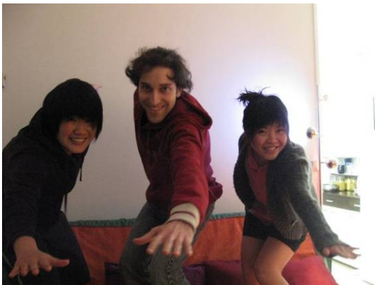
We surfed the couch! 在巴黎供我們住宿的沙發主人

由於預算有限，而且我很想用窮學生旅行的方式來體驗所有的國家，所以在住宿方面，住過青年旅舍，也試過沙發衝浪省住宿費。沙發衝浪更早的意思是指「客人到家裡借宿，沒床，就睡沙發吧！」現在的沙發衝浪，是一個串連世界文化的平台，它不只是提供背包客落腳處，更能藉此機會跟招待的主人聊天認識進而了解當地人的生活文化。我更體驗搭乘破舊、龜速且有點危險的烏克蘭夜間火車跨越其他都市，我想除了Hitch-hiking(搭便車)我沒試過之外，其他都差不多試過了。我想唯有用此方式才能更深入了解各國的風土民情，我非常享受跟各國交換生、Hostel住同寢的陌生室友或是跟沙發主人聊天的時光，這些都是作國民外交的大好機會。(續下頁)