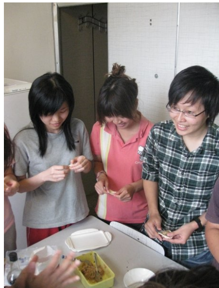
動手包水餃給外國人吃

這將近七個月的生活下來，很多人問我「好不好玩?」，我覺得百感交集。以下是我對這趟旅程的一些感想。「這是一段不斷逼我自己長大的旅程。」有人說海島型國家的人通常擁有冒險犯難的精神，對外面的事情容易有很多想像的畫面，會想要出去外面闖盪，看看這個世界有多大。但我到歐洲後發現，其實住在一塊擁有非常多國家的大陸上的人會更有這樣的想法及精神。現代傳播科技發達，一彈指，就可以知道十萬八千里以外的國家的一些消息。拜交通發達所賜，外國人要不只這些，他們視野很遼闊，也更願意去嘗試，懂得把握每次機會，談起他們的學生時代，總是能聽到出國交換的經歷或是讓自己休息一年，接著再利用這一個所謂的Gap Year去到各地旅行散心，不管是嘗試背包客的方式、美國暑期打工、紐澳打工度假或是到其他國家讀語言學校都好，對自己都是一場學習，他們老早就對這個世界有多大了有了概念。現在要台灣人踏出寶島，搭上飛機飛到這麼遠的地方待長達半年，我想對很多人都是一個大大的挑戰，心情會是一場煎熬。(續下頁)